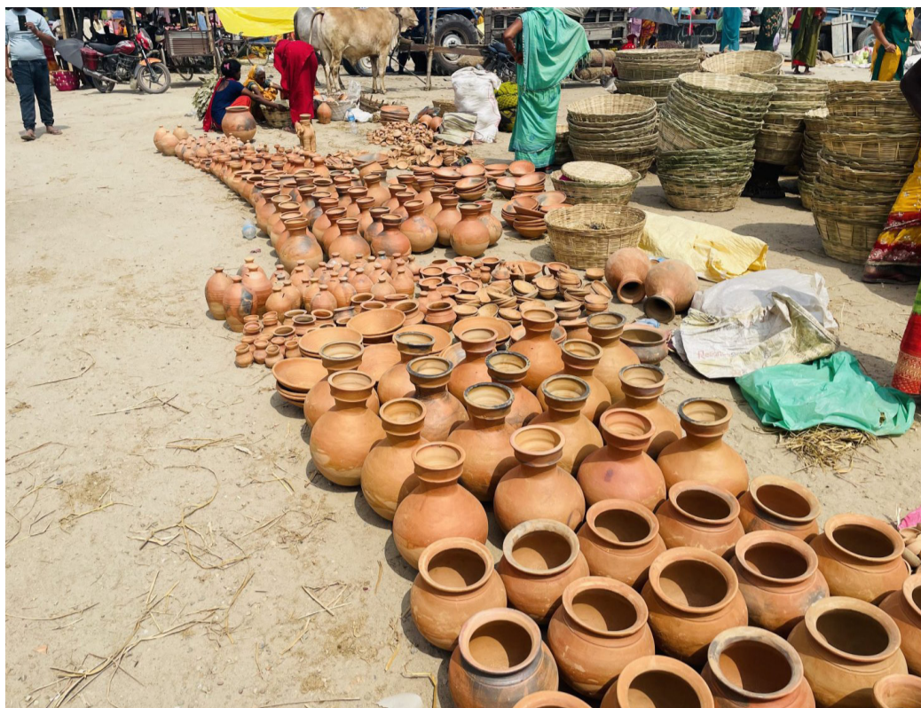
भनिन्छ। दुवै अवसरमा ब्रतालुहरूले अस्ताउँदै र उदाउँदै सूर्यलाई अर्घ्य दिने धार्मिक परम्परा समान रूपमा पालना गर्छन्।

यसैबीच, स्थानीय तह तथा समुदायले छठ घाटको सरसफाइ र सजावटमा विशेष ध्यान दिएका छन्। बजारमा देखिएको चहलपहलले पर्वको धार्मिक महत्त्वसँगै स्थानीय आर्थिक गतिविधि बढाएको संकेत गरेको छ। वर्षमा दुईपटक छठ पर्व मनाउने परम्परा छ। कात्तिक महिनामा मनाइने मुख्य छठलाई ‘कार्तिकी छठ’ र चैत महिनामा मनाइने छठलाई ‘चैती छठ’