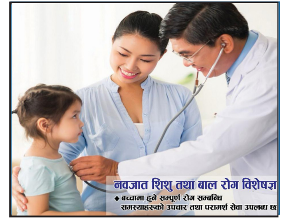
नवजात शिशु तथा बाल रोग विशेषज्ञ ◆ वयामा हुने सम्पूर्ण रोग स्वबलिय समस्याहरूको उपचार तथा परामर्श सेवा उपलब्ध छ