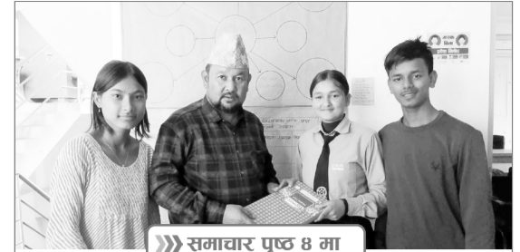
» समाचार पृष्ठ 8 मा

नगर बाल क्लबलाई नगरपालिकाको आर्थिक सहयोग