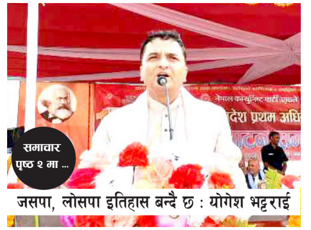
समाचार पृष्ठ २ मा ...